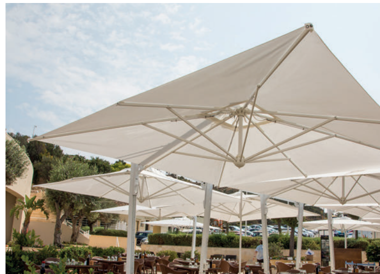
RADISSON HOTEL MALTA